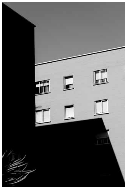
Tagakaas / Back cover Dominique Philippe Bonnet Post Meridiem

1 Fotograafia erinevad näod ja jäljed THE DIFFERENT FACES AND TRACES OF PHOTOGRAPHY Kristel Schwede