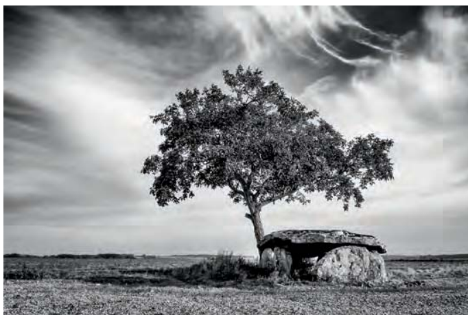
Dolmen de Vaon, Les Trois-Moutiers (86).