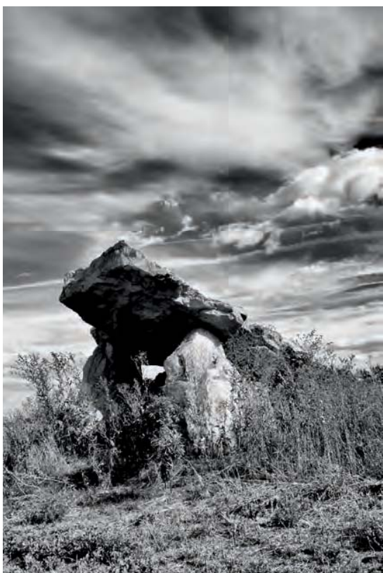
Dolmen de Briande, Arçay (86).