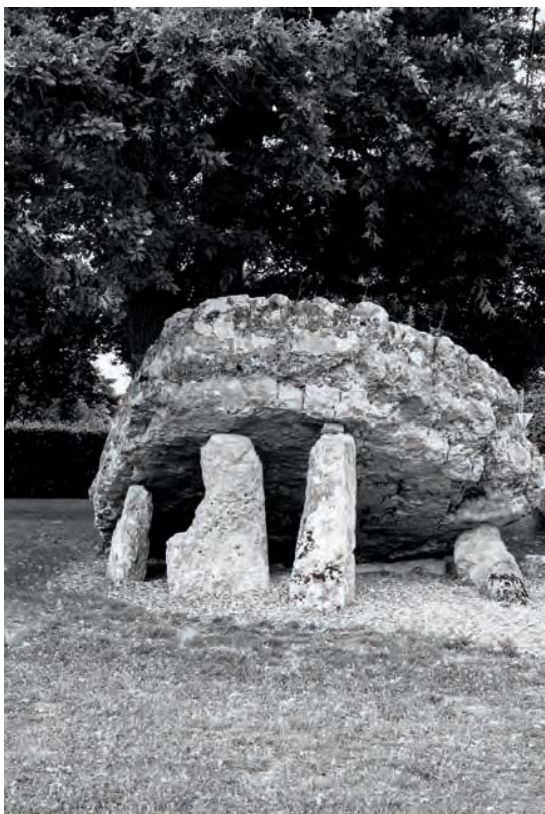
Dolmen de la Pierre Levée, Poitiers (86).