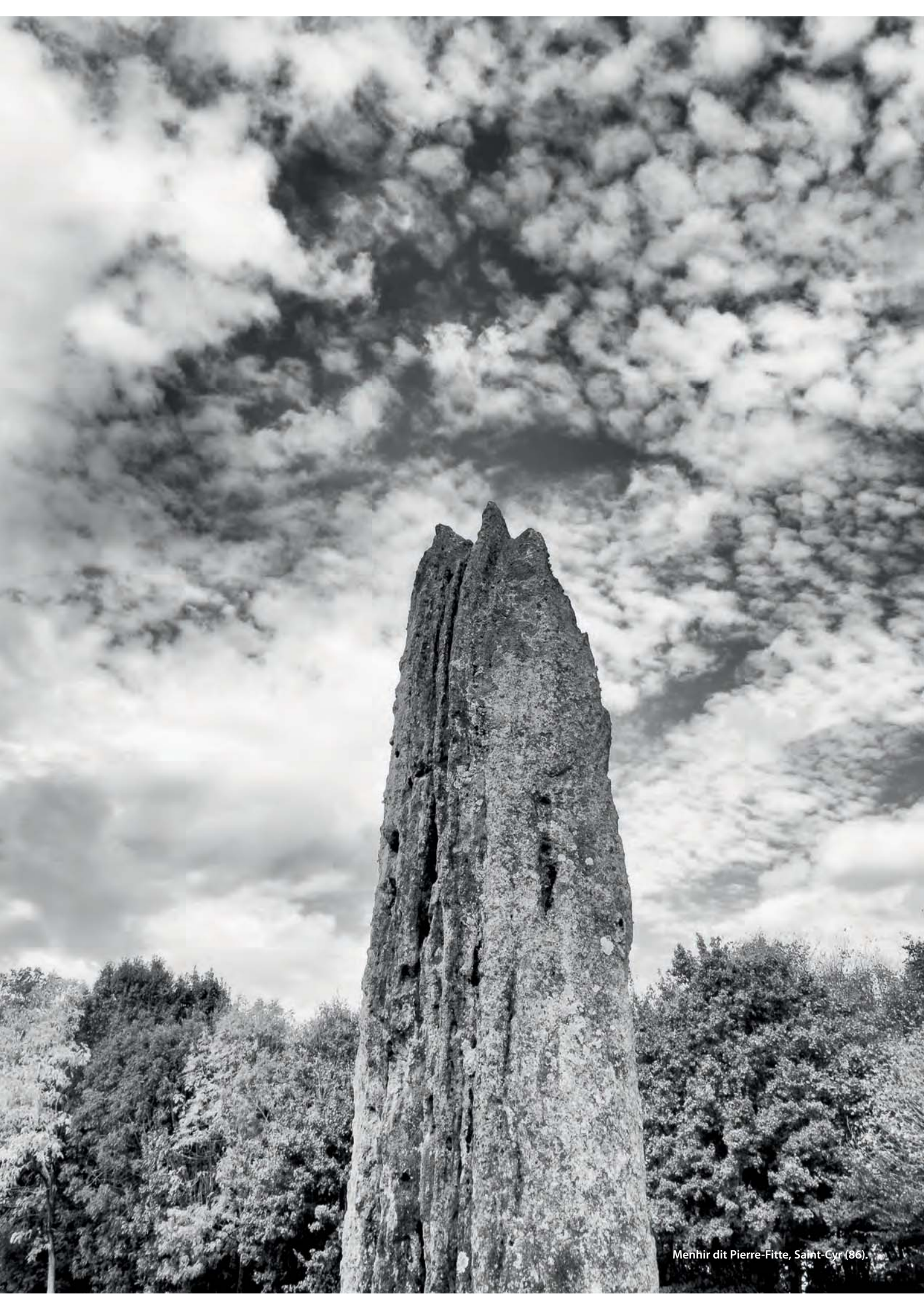
Menhir dit Pierre-Fitte, Saint-Cyr (86).