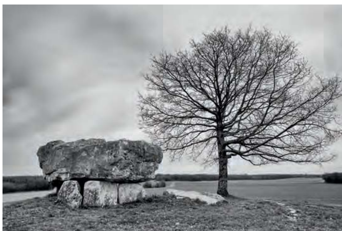
Dolmen dit la Petite Pérotte, Fontenille (16).