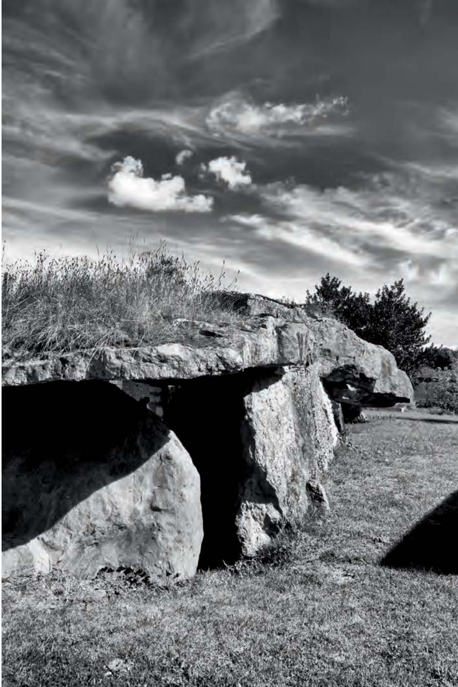
Dolmen dit la Pierre Folle, Bournaud (86).