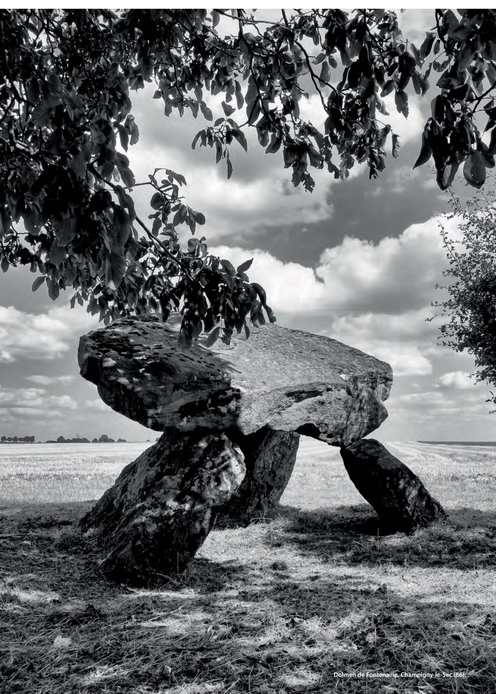
Dolmen de Fontenaille, Champigny-le-Sec (86).