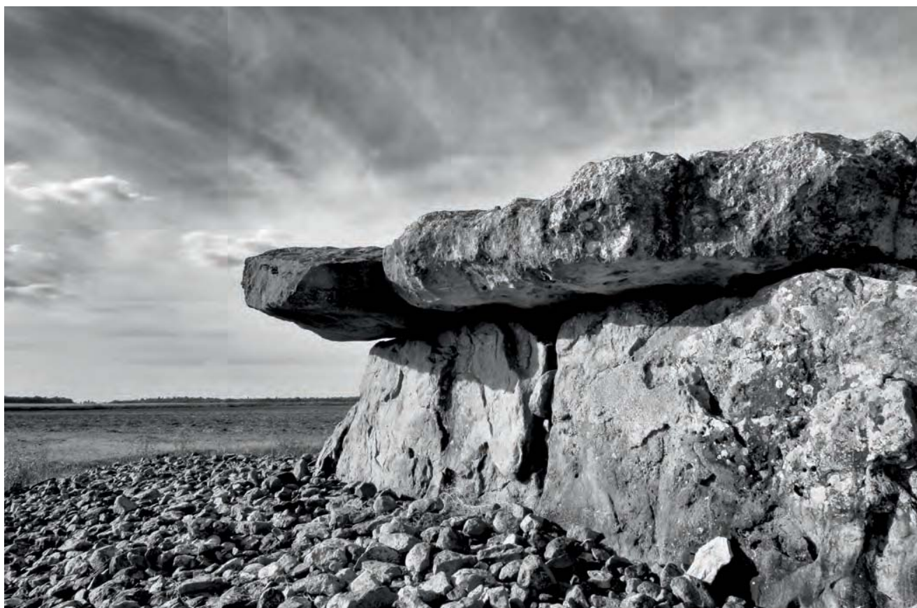
Dolmens de Maranzais, Taizé (79).