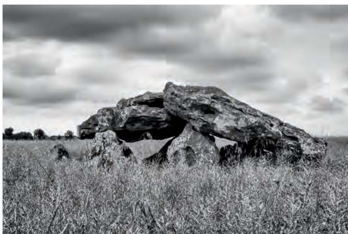
Dolmen dit la Pierre-Levée, Neuville-de-Poitou (86).