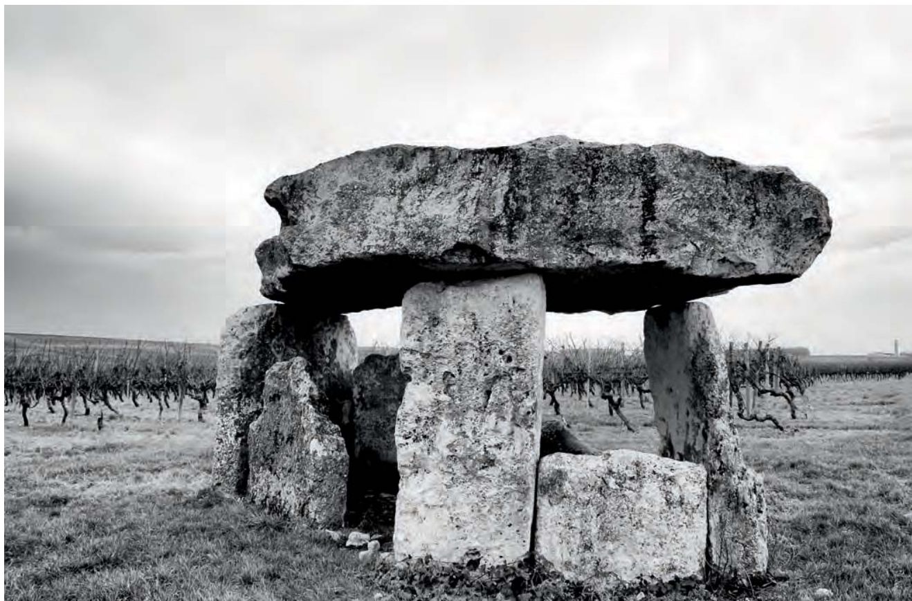
Dolmen dit la Pierre-Levée, Saint-Fort-sur-le-Né (16).