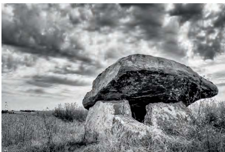
Dolmen de la Fontaine, Saint-Léger-de-Montbrillais (86).